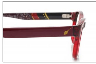
忠実に再現するために細部までこだわりを。