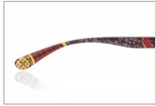
テンプルエンドには、それぞれの紋を配置。