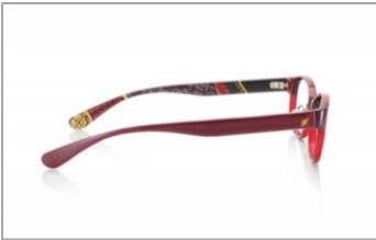
各キャラクターの象徴となるカラーを採用。

メガネの型は使いやすいウエリントンタイプとスクエアタイプをご用意。フレームは各キャラクターの象徴となるカラーを採用することで、それぞれの個性を忠実に再現。テンプル（メガネのつる）エンドには、キャラクターの紋をあしらうなど細部にまでこだわりました。巻物状にデザインされた特製のオリジナルケースと専用のセリートも必見です。