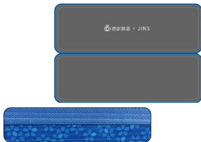
オリジナルケース

「西武鉄道×JINS」限定のオリジナルケース(1種)と、オリジナルセリート(2種)にもこだわりが満載。