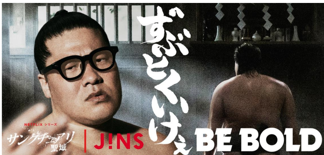
着用：ウエリントン ブラック

株式会社ジンス（東京本社：東京都千代田区、代表取締役 CEO：田中仁、以下 JINS）は、JINS 史上最も太く、最も厚みがありながら、軽量樹脂素材を使用した軽やかなかけ心地が特長の「BE BOLD（ビー ボールド）」を本日 2023 年 7 月 27 日（木）より一部の JINS 店舗および JINS オンラインショップ（ https://www.jins.com/jp/bebold/ ）にて発売します。本製品の発売に合わせて、Netflix シリーズ『サンクチュアリ -聖域-』とのコラボキャンペーンを展開。『サンクチュアリ -聖域-』で猿桜を演じる一ノ瀬ワタルさんがメガネ姿で登場する WebCM を公式サイトおよび JINS 公式 YouTube チャンネル（ https://www.youtube.com/watch?v=Y5ZMJXsG0nM ）にて公開します。