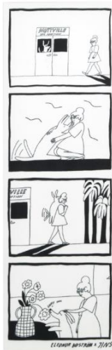
1.シヴィルとエドガー LRF-21A-020 LMF-21A-026