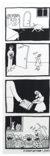
3.変装しなきゃ LRF-21A-019 LMF-21A-023