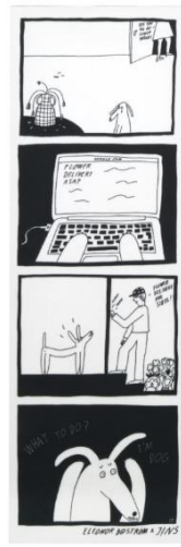
2.枯れちゃった LRF-21A-021 LMF-21A-024