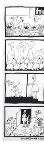
4.お花パーティー LRF-21A-022 LMF-21A-025