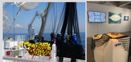
廃漁網を 100%活用したプロトタイプを展示

これからも、環境に配慮した素材の在り方について、新たな可能性を模索し、アイウェアのサステナビリティを推進してまいります。