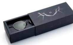
オリジナルボックス