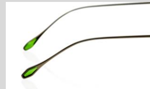
腕パーツをイメージしたテンプルエンド