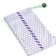
オリジナルソフトケース