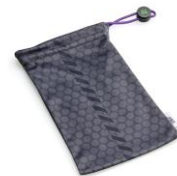
オリジナルソフトケース