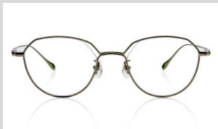
初号機の目を再現したレンズとリムの隙間