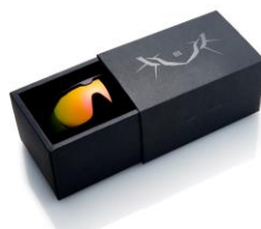
オリジナルボックス