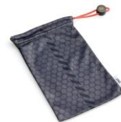
オリジナルソフトケース