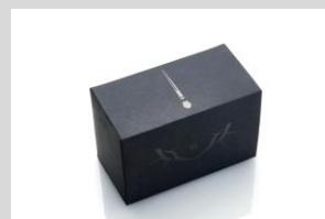
オリジナルボックスも高級感のある仕様に