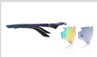
気分に合わせて付け替え可能なレンズ付き