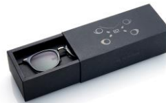
オリジナルボックス