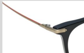
胸のパーツを表現したヨロイ