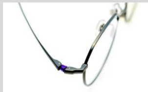
エヴァンゲリオンの動きをイメージした2段式の丁番