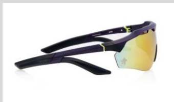
耳裏とこめかみで挟み込むモダンが、鼻パッドレスのデザインを実現