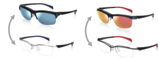
MMN-20S-079 / 2 色