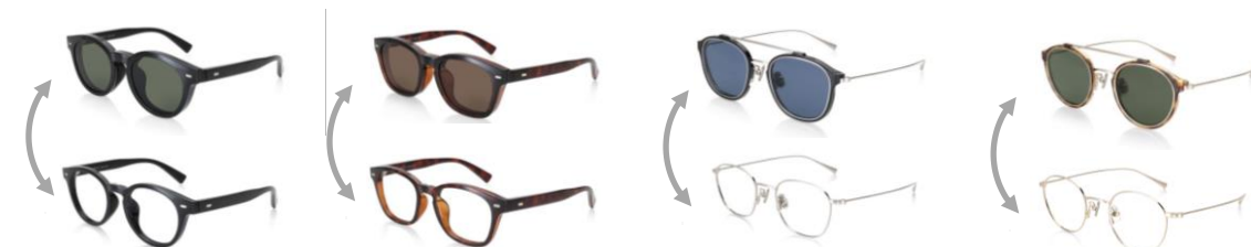
MMF-20S-181 / 3 色